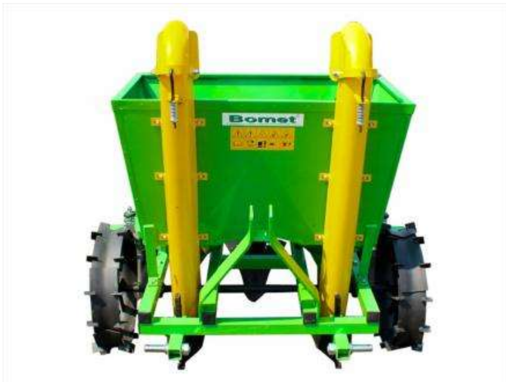
KARTUPEĻU STĀDAMĀ MAŠĪNA

Lauksaimniecības tehnika ļaus uzlabot studentu un izglītojamo praktisko sagatavotību. Ir noslēgts līgums par Lauksaimniecības tehnikas laboratorijas vienkāršoto atjaunošanu ar SIA BŪVE WOOD LINE