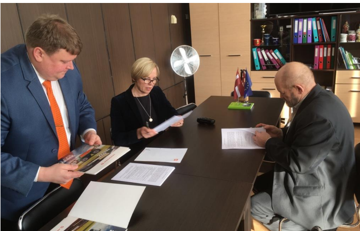
Piegādes līgumu parakstīšana ar SIA AMAZONE LATVIJA