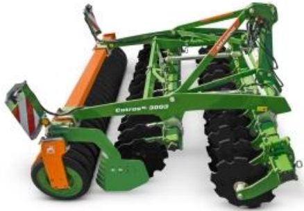
AMAZONE – CATROS+3003 SPECIAL