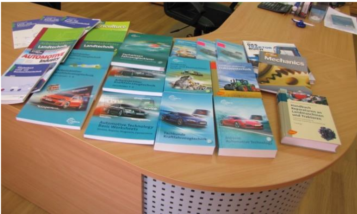
SIA AUTODATI un APGĀDS ZVAIGZNE ABC Piegādāja mācību literatūru Lauksaimniecības specialitātes studentiem ; Autotransporta un citās jomās